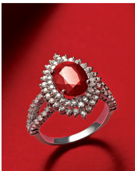
Rubínový prsteň Match - prírodný barmský rubín (3 karáty) a diamanty osadené v bielom zlate.