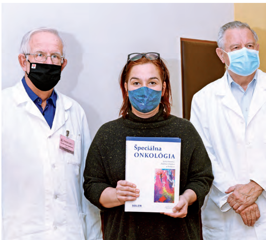
Hlavní zostavovatelia publikácie Špeciálna onkológia a riaditeľka vydavateľstva SOLEN.

Vzhľadom na pretrvávajúcu situáciu sa v Onkologickom ústave sv. Alžbety (OÚSA) uviedlo do života najnovšie dielo, publikácia Špeciálna onkológia, netradične. Účastníci tvorivého tímu autorov, recenzentov ako aj ďalší účastníci si dielo prevzali postupne, jeden za druhým, aby sa tak vylúčili naraz osobné kontakty väčšej skupiny. Viacerí vtipne poznamenali, že si môžu symbolicky knihu pokrstiť doma aj sami. Zároveň už vážne, vyzdvihovali prínos celého tímu. Mnohí sa stotožnili s tvrdeniami, ktoré sa dajú zhrnúť do stručného vyjadrenia, že sa s niečím takým výnimočným ako je táto najnovšia, krásne vyhotovená a obsahom unikátna kniha dnes už málokedy dá stretnúť.