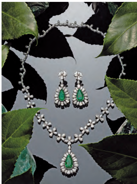
Smaragdový set Eternity of Columbia - prírodné kolumbijské smaragdy (spolu 11 karátov) a diamanty (spolu 21 karátov) osadené v bielom zlate.