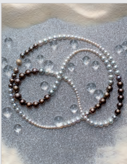
Perlový náhrdelník Silky Crown – šnúra tahitských perál a morských perál Akoya s uzáverom z bieleho zlata.