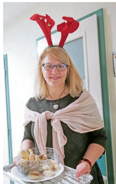
Jedno z najjemotívnejších stretnutí s pacientmi bývalo každoročné predvianočné koledovanie.