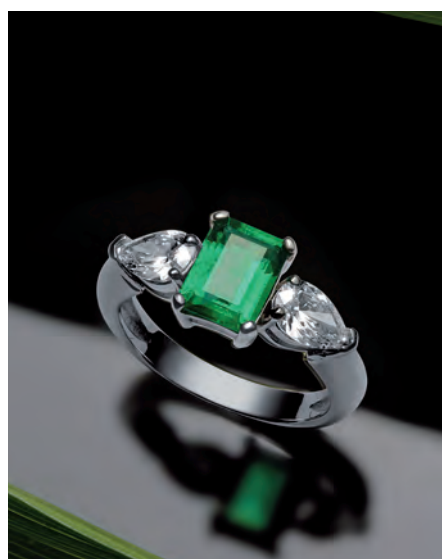
Smaragdový prsteň Morvena - prírodný smaragd a diamanty osadené v bielom zlate.