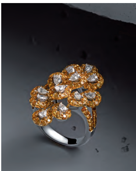
Diamantový prsteň Emphasis - prírodné žiarivé žlté a bezfarebné diamanty osadené v bielom zlate.