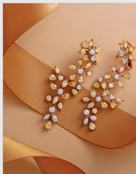
Diamantové náušnice Resistance – prírodné žlté a bezfarebné diamanty osadené v žltom zlate.