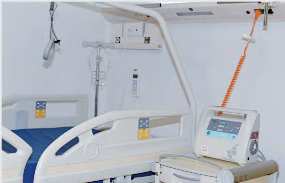
Onkologický ústav sv. Alžbety je dnes moderné špecializované onkologické centrum.

sa tak prijme približne 7800 pacientov. Na úseku zdravotnej dokumentácie a archívu chorobopisov sa po ukončení hospitalizácie zdravotná dokumentácia skontroluje a založí do archívu. Úsek zdravotnej štatistiky zabezpečuje ročné spracovanie zákonom stanovených štatistických zisťovaní jednotlivých odborných pracovísk pre potreby NCZI. Úsek sociálnej starostlivosti poskytuje poradenstvo v oblasti sociálnych služieb.