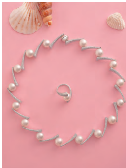
Perlová súprava Meridian - juhomorské kultivované perly a prírodné diamanty osadené v bielom zlate.