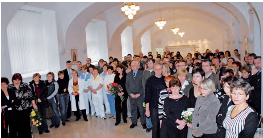
Vzhľadom na protiepidemiologické opatrenia Rehoľa svätej Alžbety a zamestnanci Onkologického ústavu sv. Alžbety tohto roku žiaľ nemali možnosť, tak ako na fotografii z minulosti, verejne sláviť sviatok svojej patrónky.