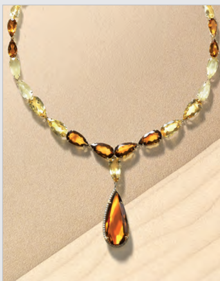
Citrínový náhrdelník Blanchet – prírodné citríny, rutilizované kremene a osadené v žltom zlate.