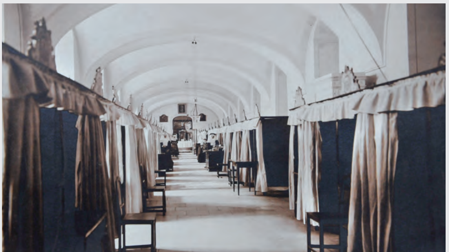
Známa fotografia pôvodnej najväčšej lôžkovej sály nemocnice, dnes sa tu nachádza jedáleň zamestnancov.