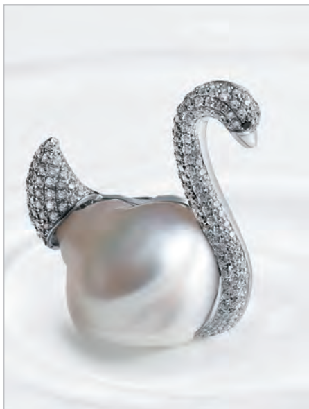
Principessa del Lago - unikátna juhomorská kultivovaná perla a prírodné diamanty osadené v bielom zlate.